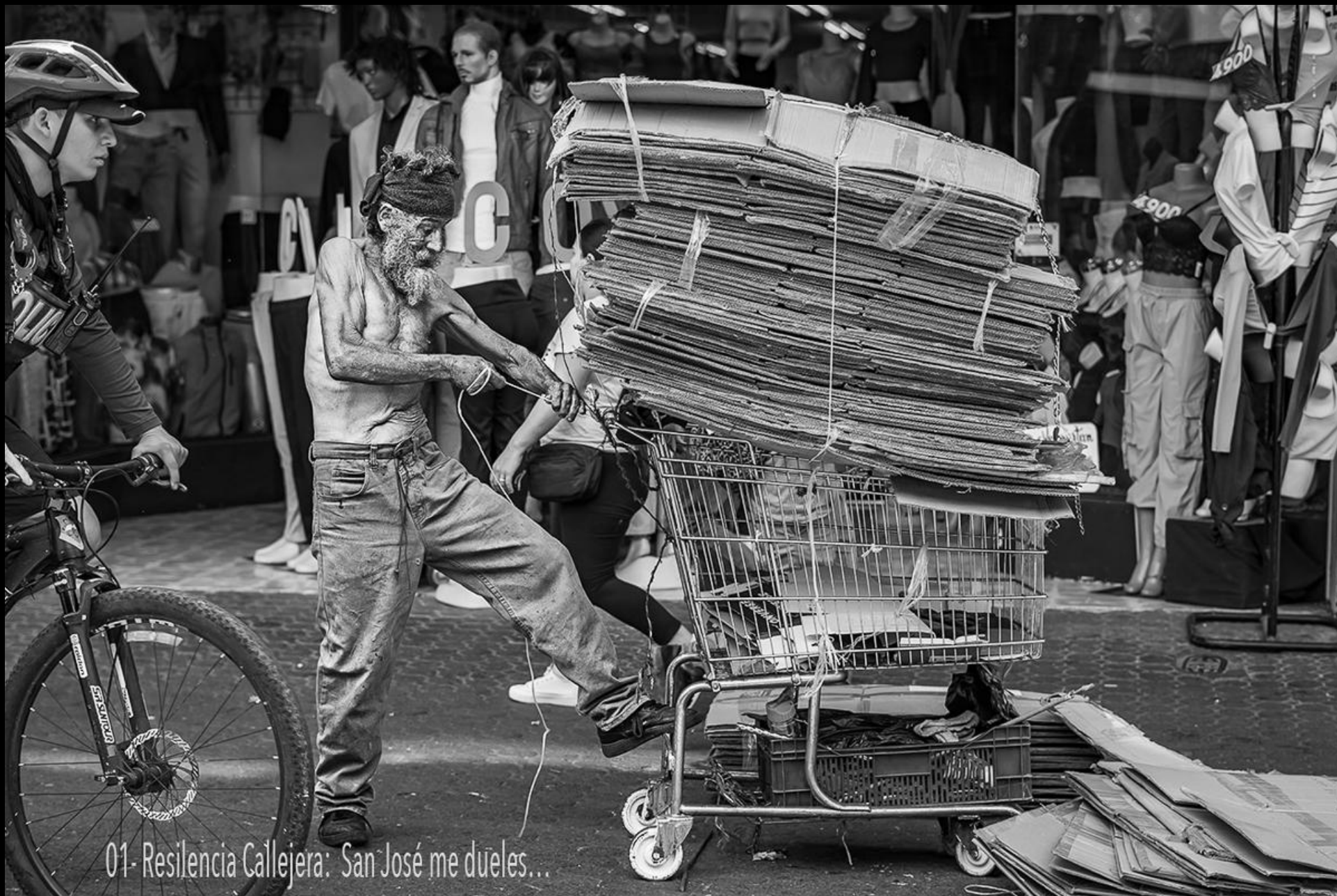
01- Resiliencia Callejera: San José me dueles...

Foto N° 33 Tema: 9,08 Técnica: 8,89 Impacto: 8,92 NOTA: 8,96