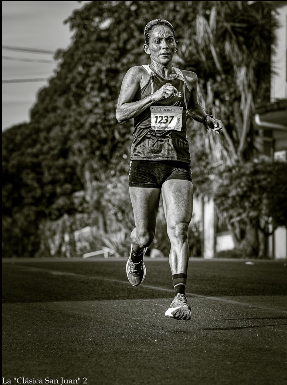
La "Clásica San Juan" 2

Foto N° 42 Tema: 7,93 Técnica: 6,78 Impacto: 6,6 NOTA: 7,1