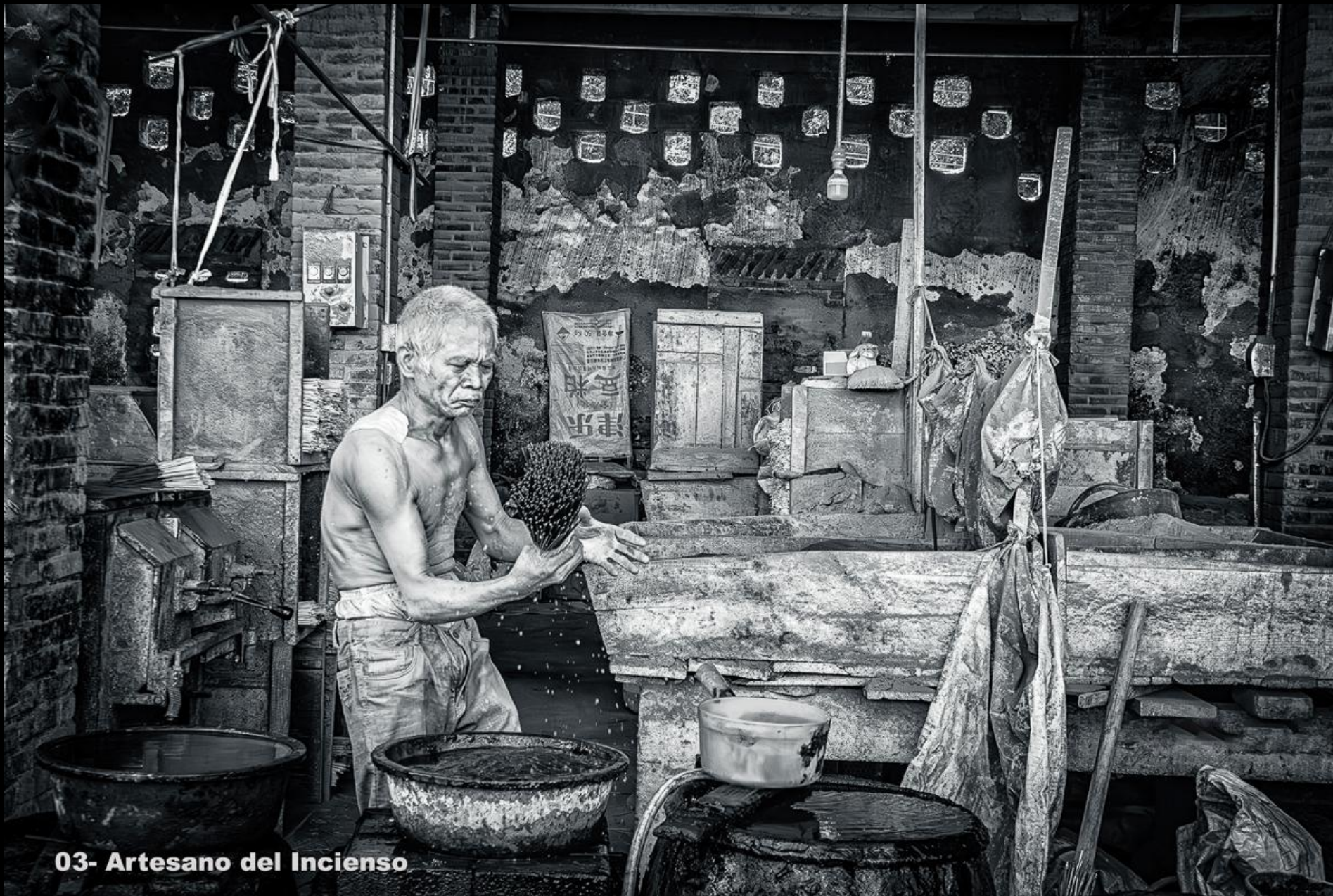
03- Artesano del Incienso

Foto N° 27 Tema: 9,05 Técnica: 8,95 Impacto: 8,85 NOTA: 8,95