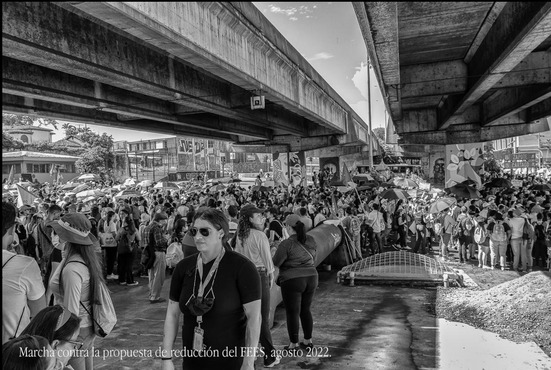
Marcha contra la propuesta de reducción del FEES, agosto 2022.