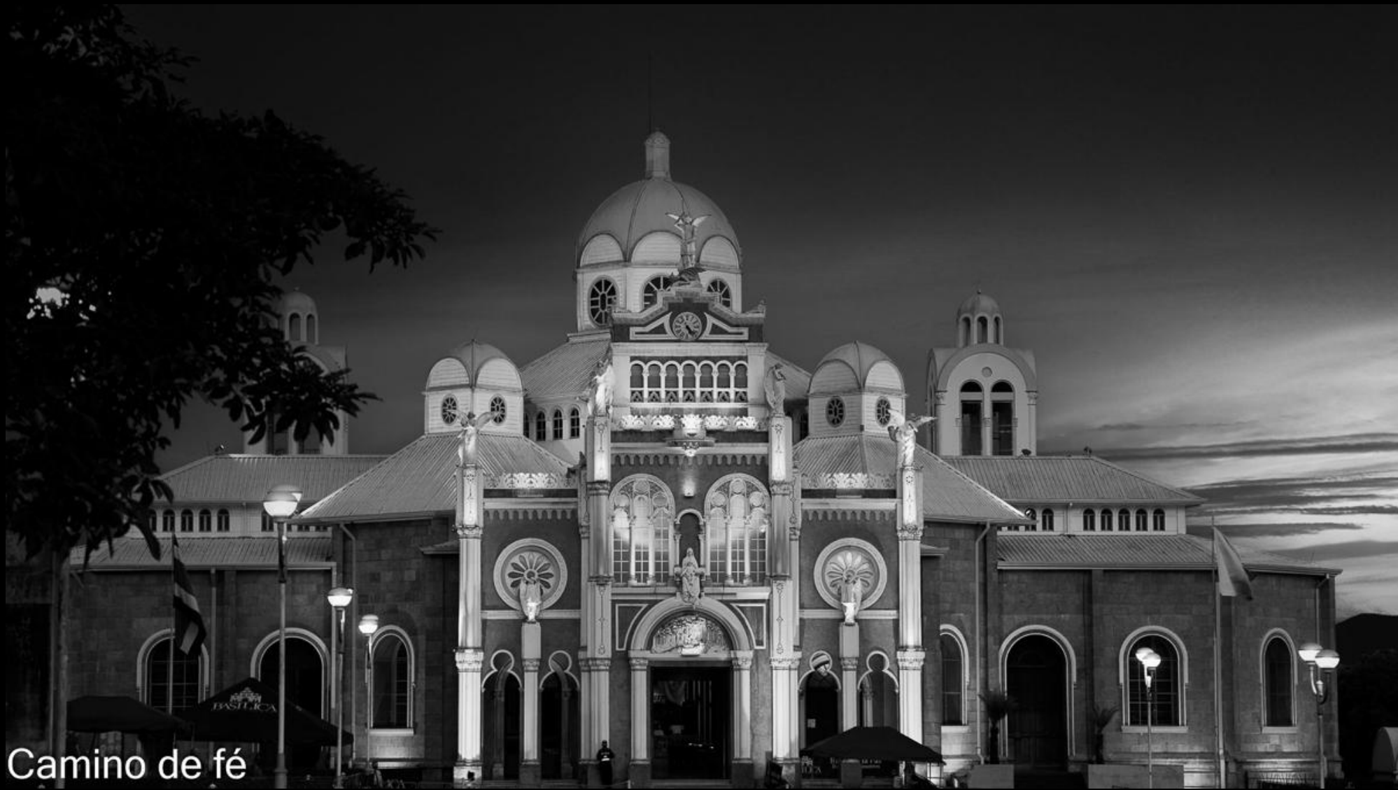
Camino de fé

Foto N° 29 Tema: 8,65 Técnica: 8 Impacto: 7,83 NOTA: 8,16