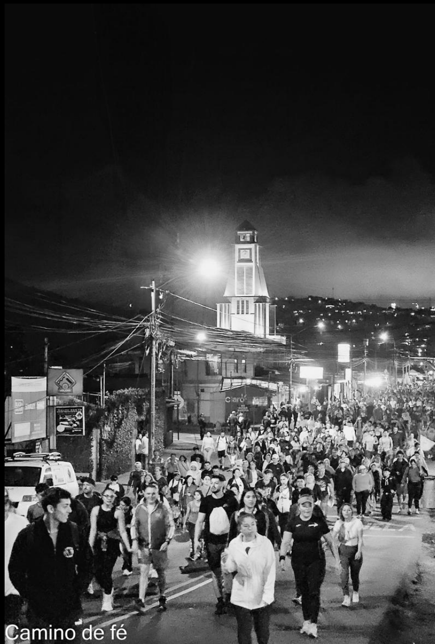
Camino de fé