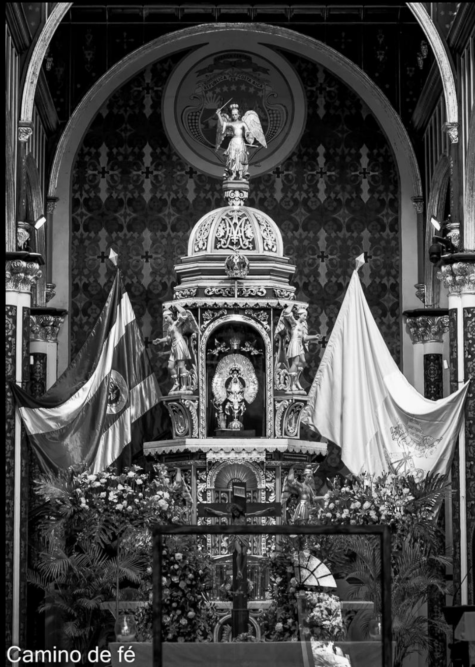
Camino de fé