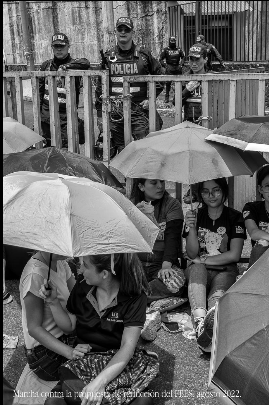
Marcha contra la propuesta de reducción del FEES, agosto 2022.