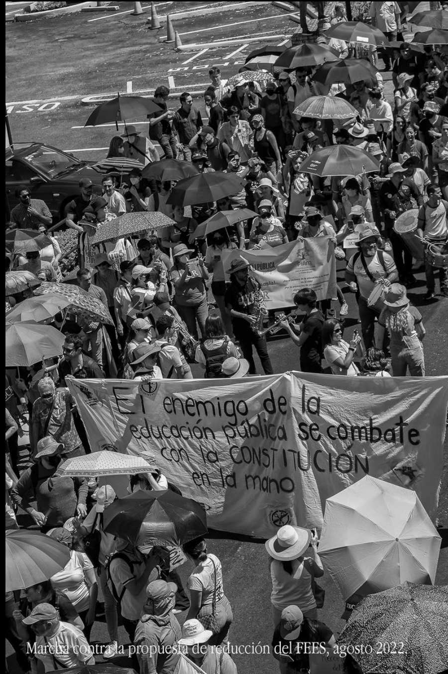
Marcha contra la propuesta de reducción del FEES, agosto 2022.

Foto N° 7 Tema: 8,15 Técnica: 7,33 Impacto: 7,4 NOTA: 7,63