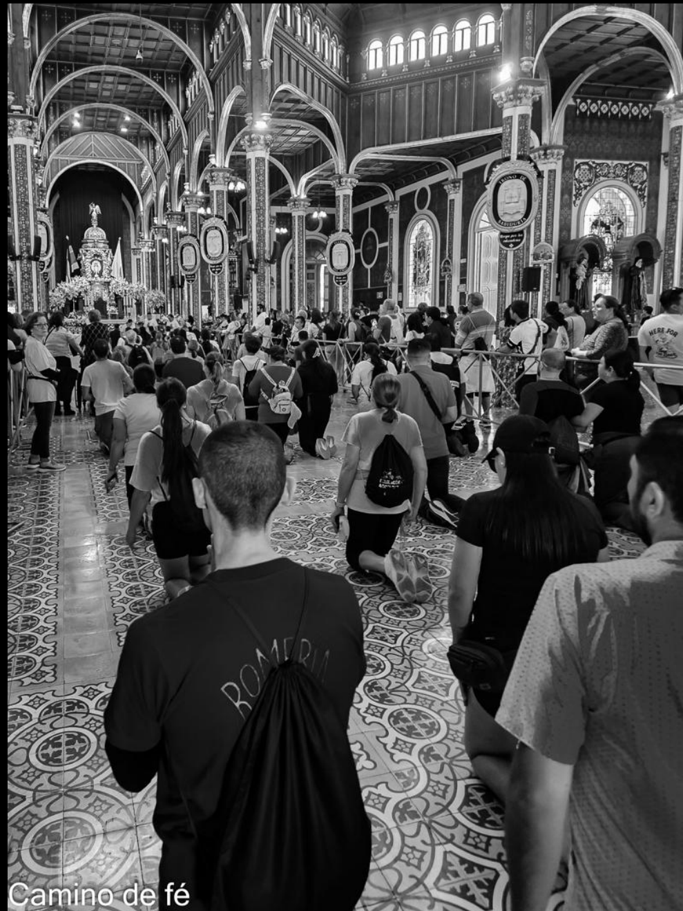
Camino de fé

Foto N° 31 Tema: 8,38 Técnica: 7,65 Impacto: 6,7 NOTA: 7,58