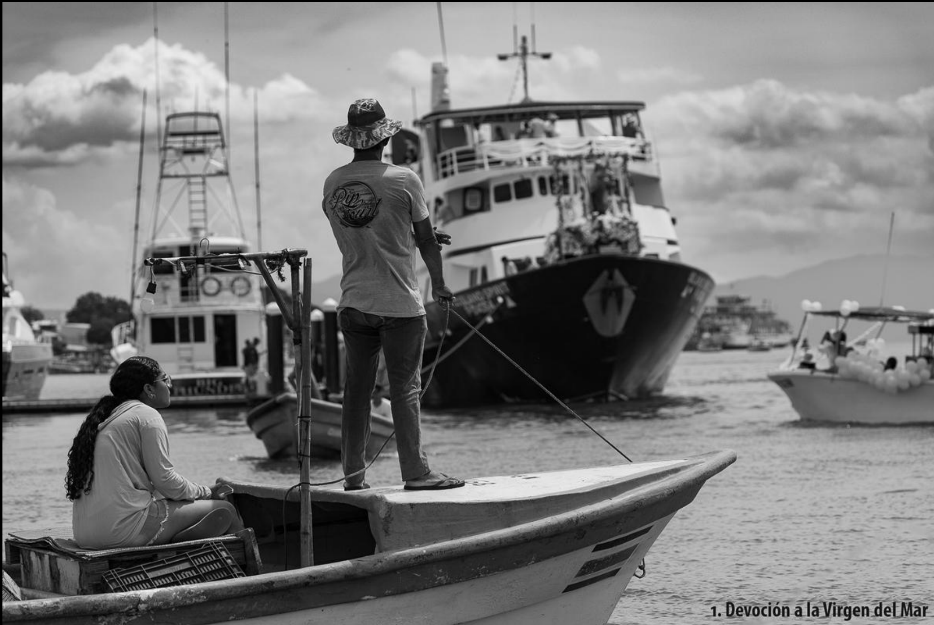
1. Devoción a la Virgen del Mar

Foto N° 17 Tema: 7,82 Técnica: 8,03 Impacto: 6,84 NOTA: 7,56