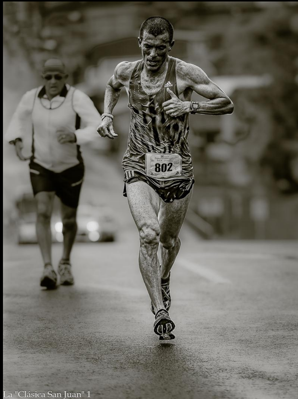
La "Clásica San Juan" 1