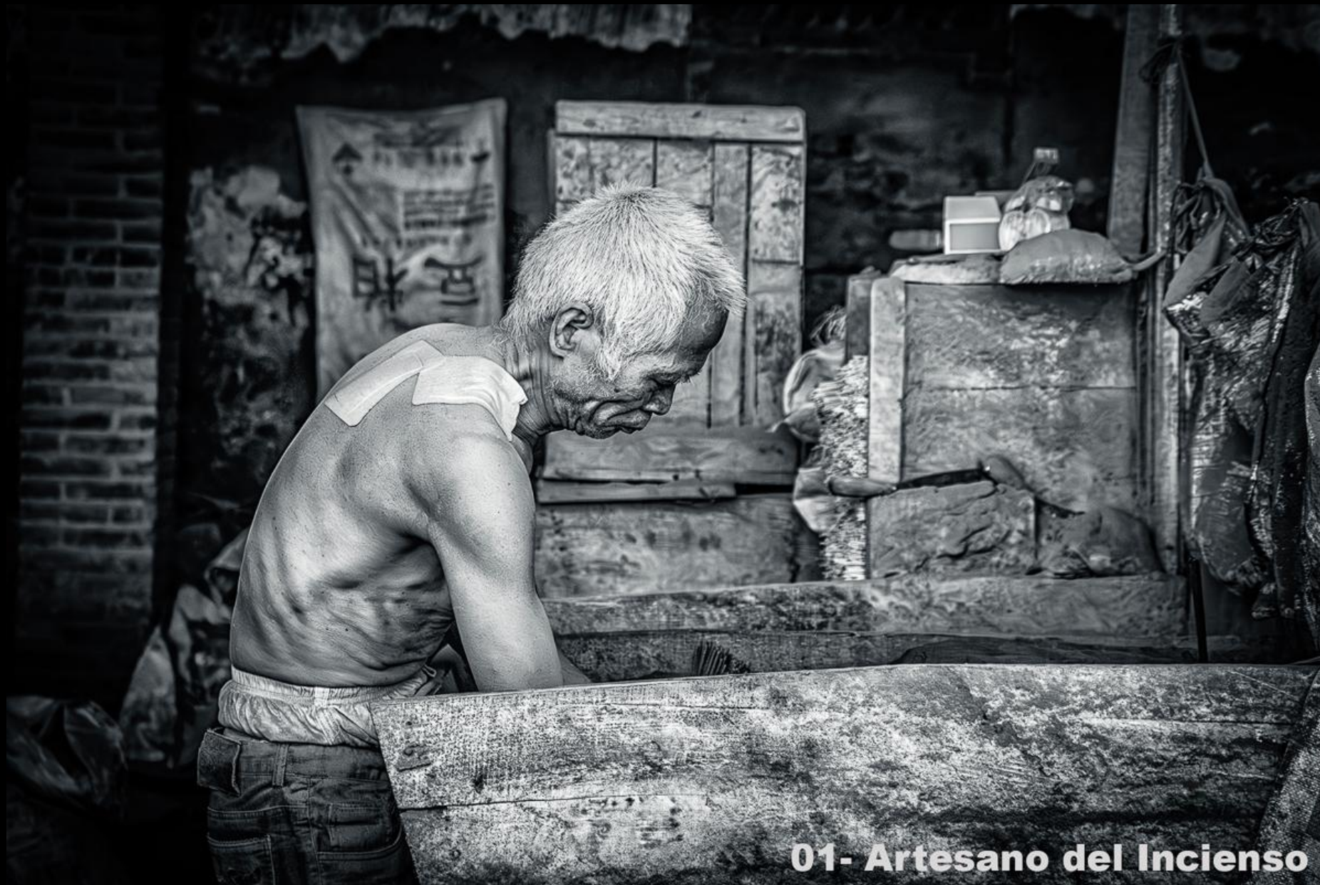
01- Artesano del Incienso

Foto N° 25 Tema: 9,03 Técnica: 8,05 Impacto: 8,32 NOTA: 8,47