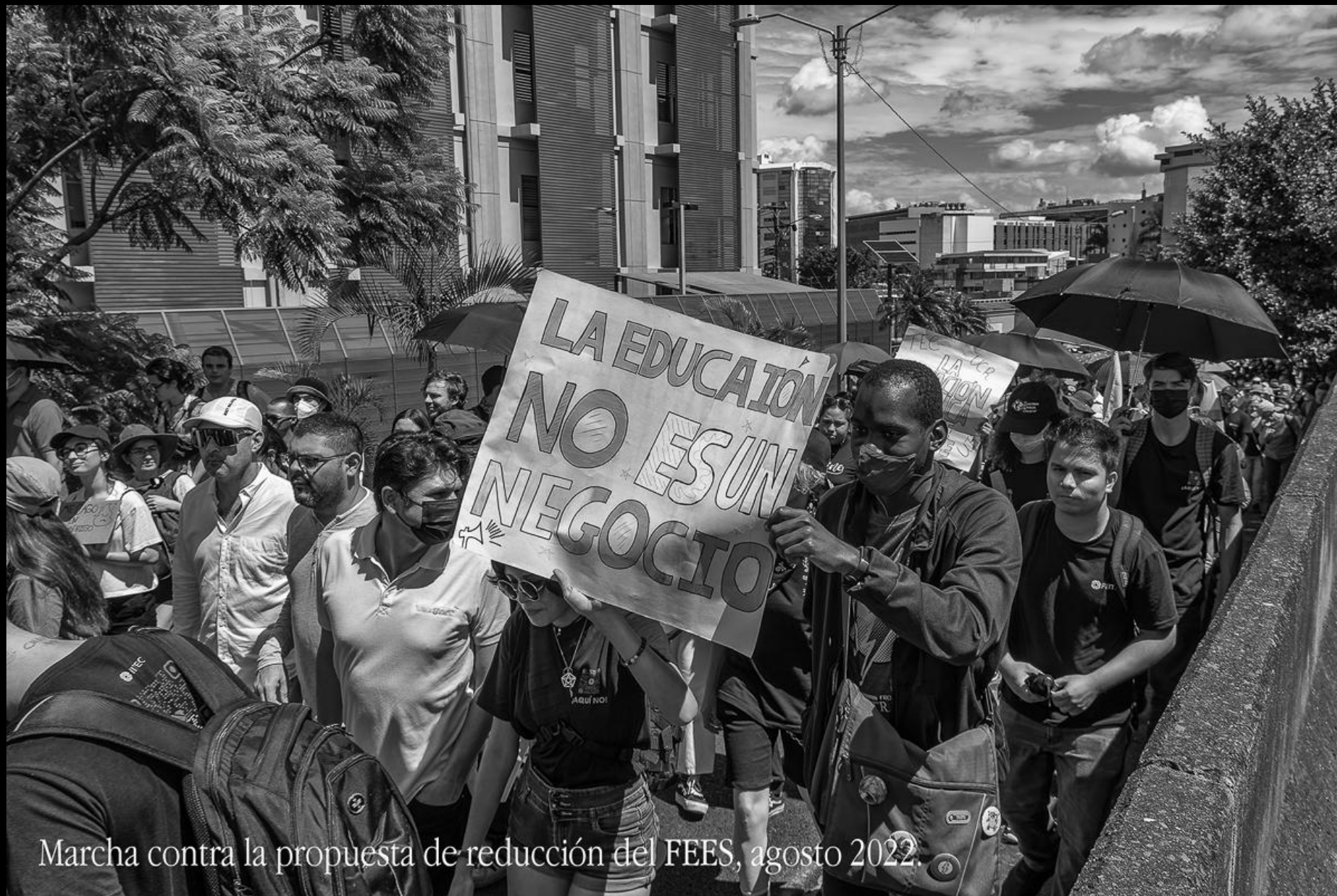
Marcha contra la propuesta de reducción del FEES, agosto 2022.