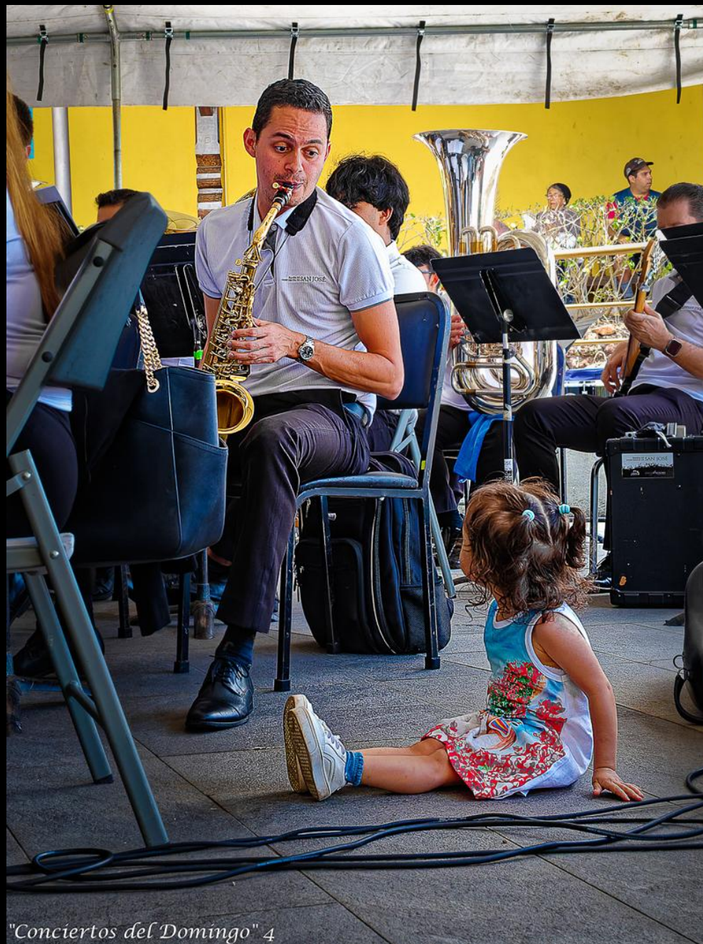
"Conciertos del Domingo" 4