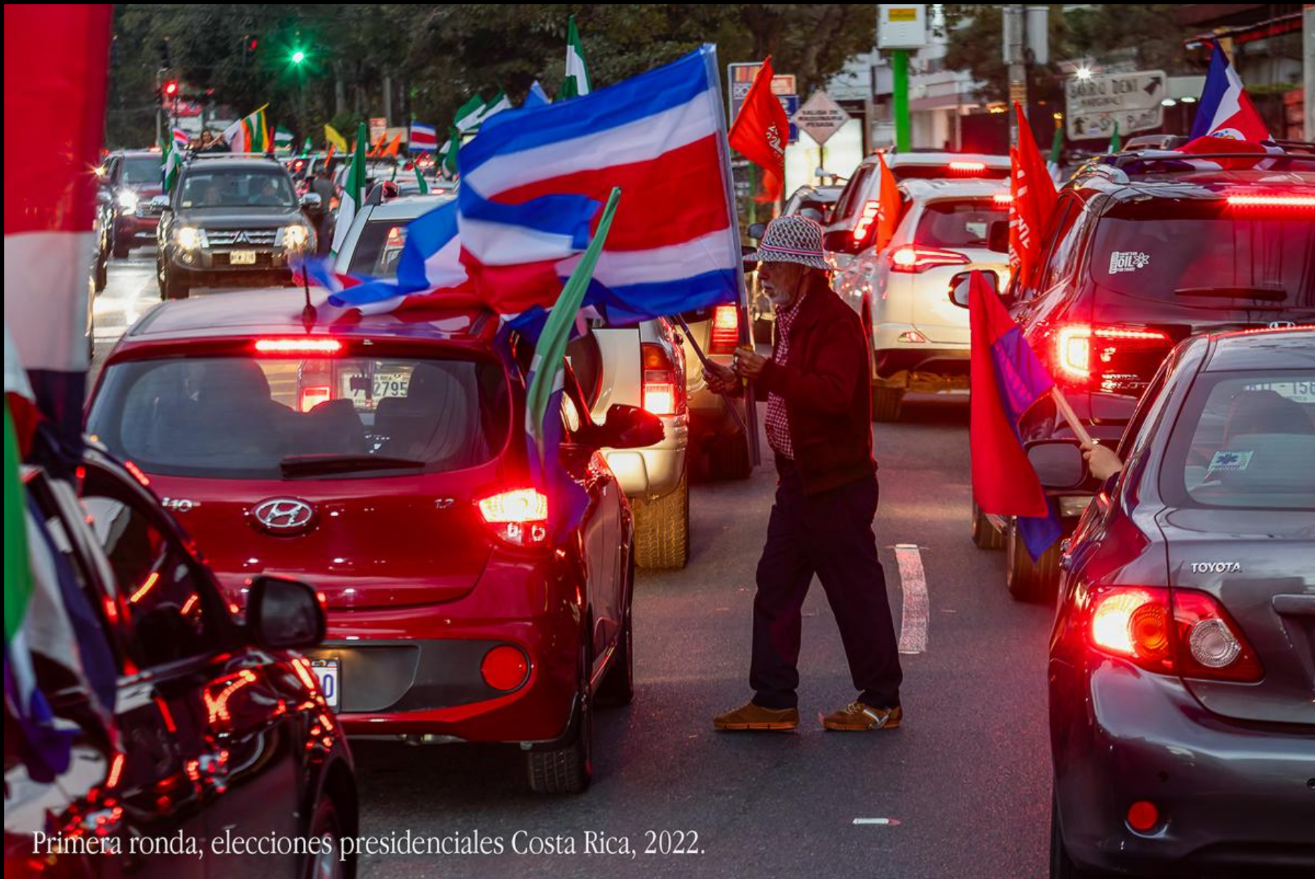
Primera ronda, elecciones presidenciales Costa Rica, 2022.