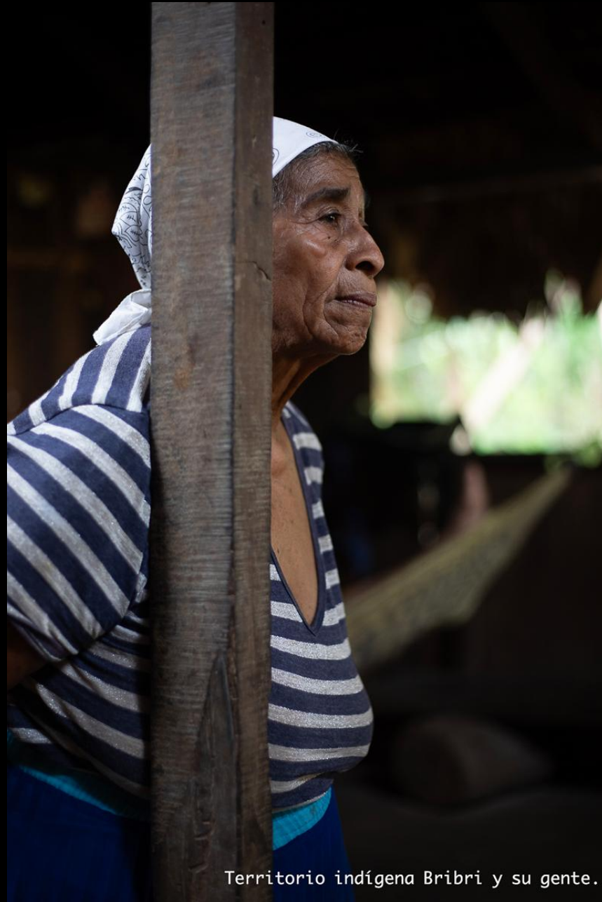
Territorio indígena Bribri y su gente.